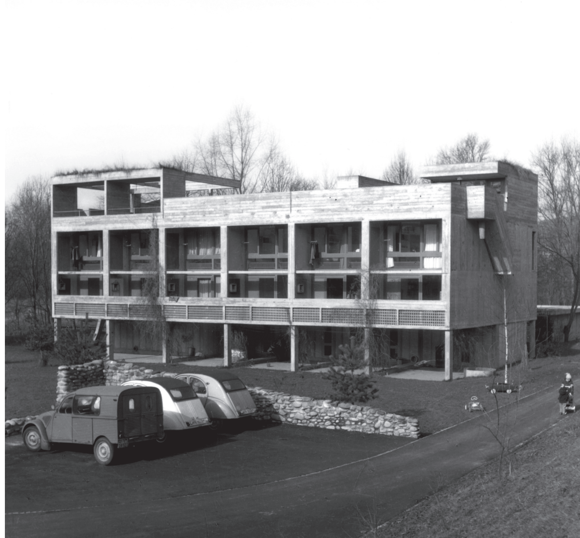
rechts: Südfassade kurz nach Fertigstellung